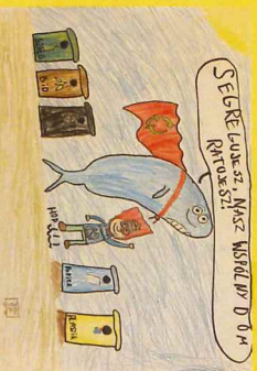
Bądźmy EKO dla Wrocławia, 2020