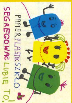
Bądź EKO Poznaniakiem, 2017