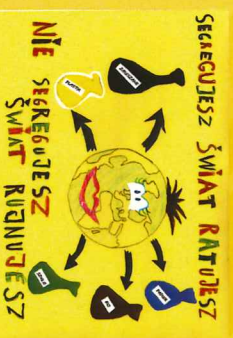
Bądźmy EKO dla Wrocławia, 2020