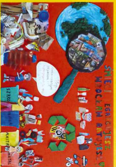
Bądźmy EKO dla Wrocławia, 2020