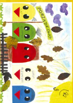
Bądź EKO Poznaniakiem, 2017